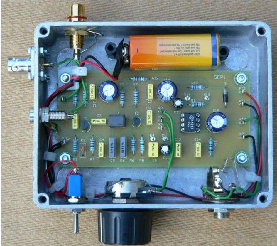
Sferics-Handempfänger, aufgebaut mit der Platine SEP1

Dieser Sfericsempfänger, Bild unten, ist mit zwei Anzeige-LEDs ausgestattet. Er eignet sich als Gewittermelder (aus „Empfangssysteme zum Detektieren von Gewittern“).