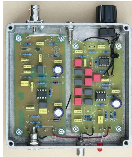
Blick in das geöffnete Gehäuse, rechts die Filterplatine